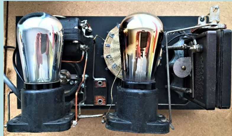
UV-201A(RCA) 2球によるシンプルな回路

選局ダイヤルによりカムが回り ブク型バリコンが本の開閉の ように動き 容量が変わる構造