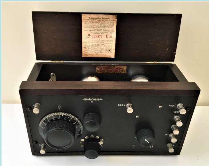
大衆用で安くて性能が良いラジオ